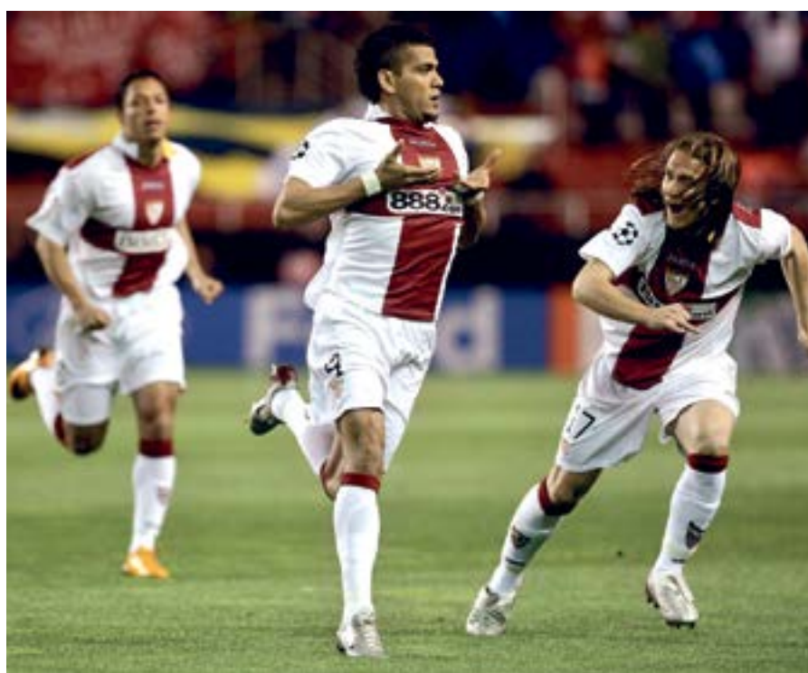
Ganó cinco títulos como sevellista.