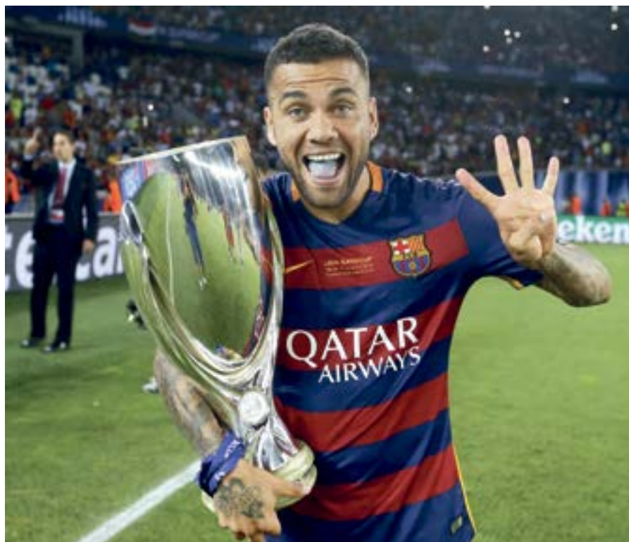
Fue traspasado al Barça por 36 millones de euros.

La relatada temporada 2007/2008 fue la última de Dani Alves en el Sevilla FC, pues esa gacela que enamoró al Pizjuán haciendo diabluras desde el carril del 2, fue traspasada al FC Barcelona por una cifra récord en el momento, 36 millones de euros. A partir de ahí, su carrera continuó siendo meteórica, ganando todos los títulos posibles con el club catalán, donde se mantuvo hasta la campaña 2015/2016, pasa pasar posteriormente a la Juventus, donde jugó una temporada, siendo indiscutible, al igual que en el PSG, donde estuvo los dos últimos cursos. Dani vive una eterna juventud a sus 36 años y aún a día de hoy demostró estar a un nivel sobresaliente, ganando la Copa America con Brasil este mismo verano, siendo uno de los mejores del torneo. Las ofertas por sus servicios fueron de todo tipo, más aún siendo un jugador libre, decidiendo finalmente regresar a Brasil para jugar en el Sao Paulo, donde viene de debutar hace unas semanas con el “10” a la espalda y convertido en el gran ídolo de su nueva afición.