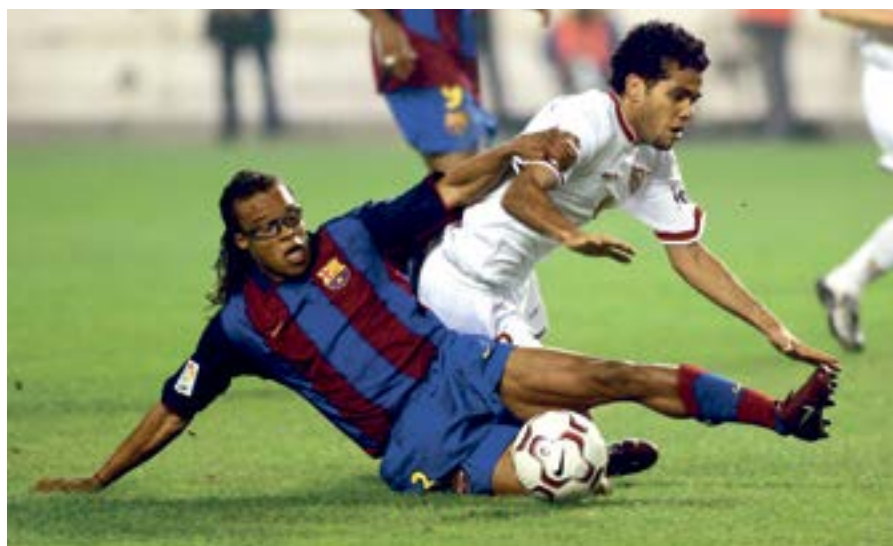
En el Pizjuan se convirtió en el mejor lateral derecho del mundo.