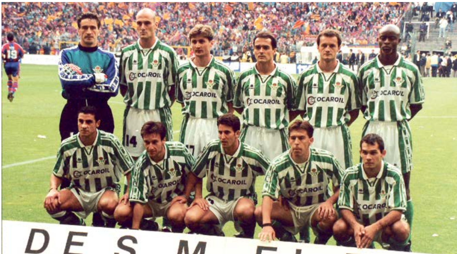
Uno de los onces tipo del Real Betis a finales de los 90.