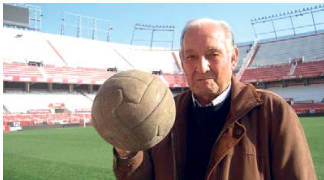
Su amor por el escudo fue infinito desde el primer momento